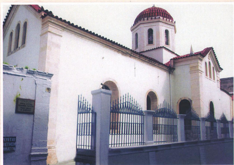
Ὁ περίπτωτος Ἱερός Ναός τῆς ΑΓΙΑΣ ΒΑΡΒΑΡΑΣ (1885)