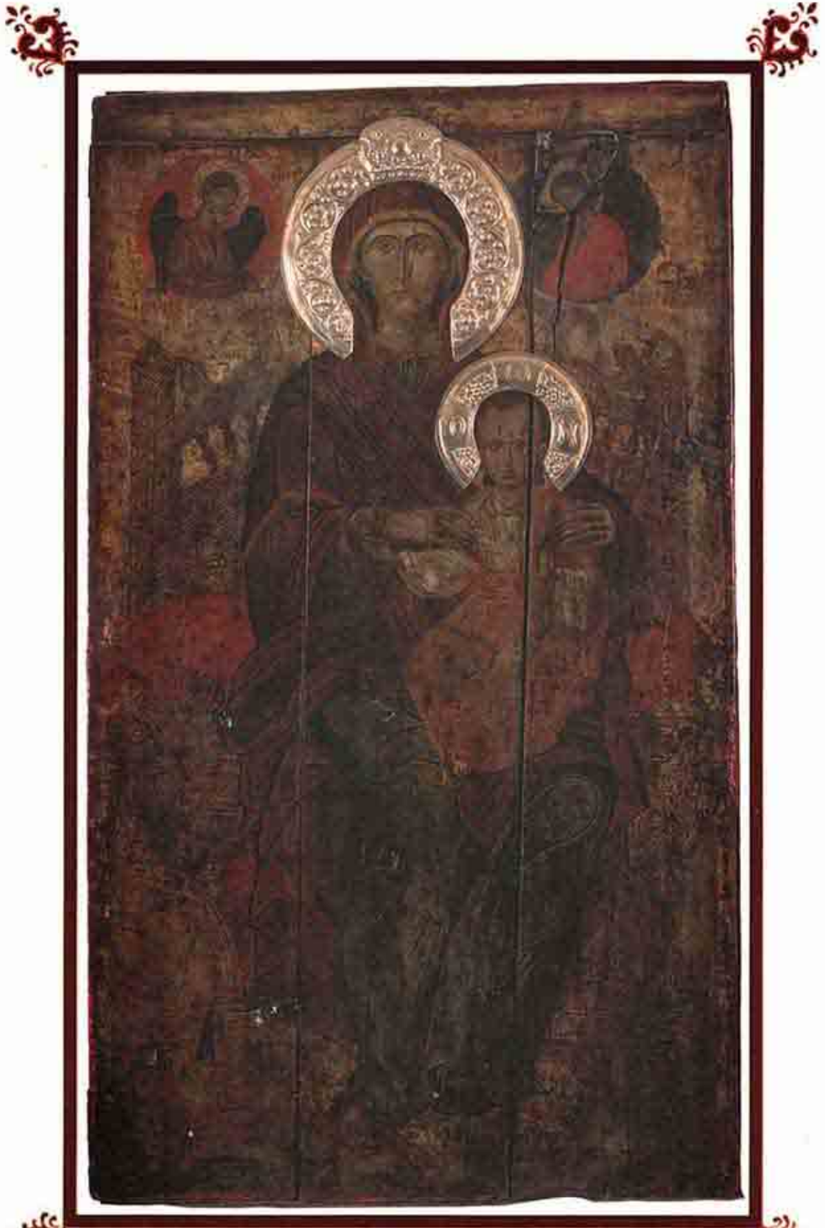
Παναγία ή 'Αντιφωνήτρια. Παλαιά, έφέστιος εικών, εύρισκομένη εις τόν 'Ι. Ναόν Γενεθλίου τής Θεοτόκου. Μυριοκεφάλων, 'Ρεθύμνου Κρήτης.